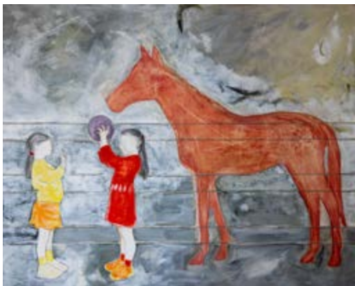
Terracotta (il mondo tra le mani)