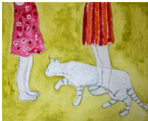
Le tre grazie (attraverso lo specchio)

LA MIA NUOVA CASA è un evento artistico costituito da 7 quadri (120 cm x 155 cm olio su tavola) dell'artista Fausto Olmelli e da un piccolo muretto a secco costruito per l'occasione al centro della sala espositiva del MAST - Museo archeologico di San Teodoro