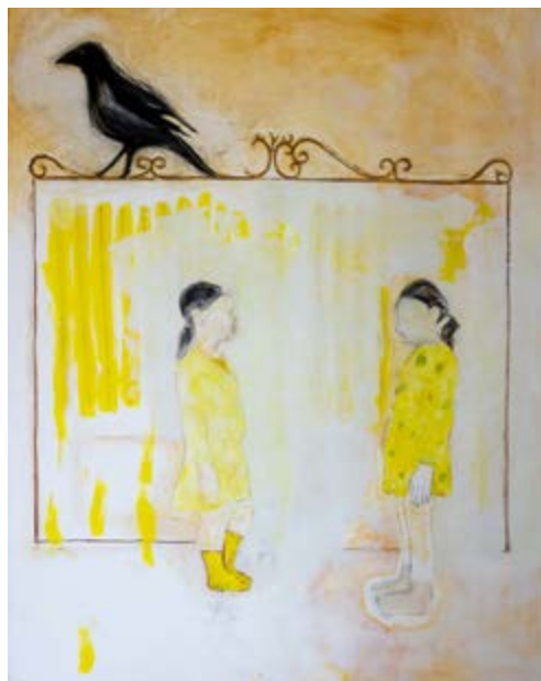
Le corbeau, u corbu