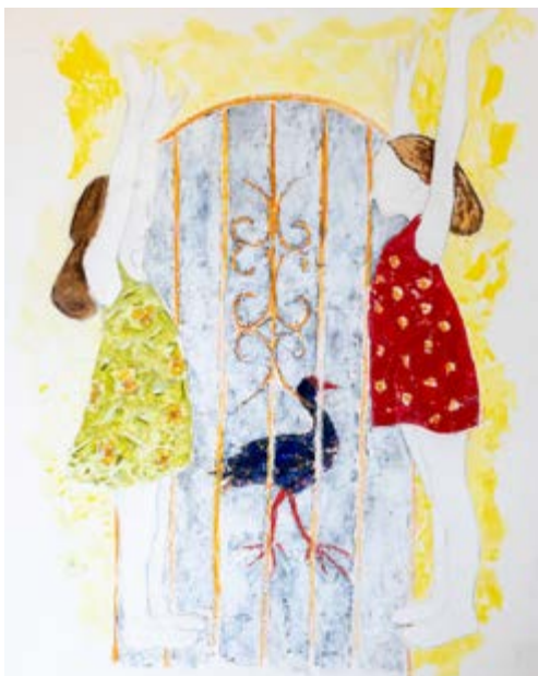
Le grand sultan